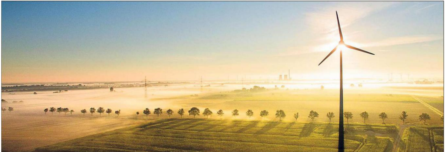
Ländliche Idylle im Zeichen des Klimaschutzes: Es müssen allerdings nicht die ganz großen Projekte sein, mit denen sich Bürger am Klimaschutzpreis beteiligen können. Die Stadtverwaltung hofft auf viele Teilnehmer.