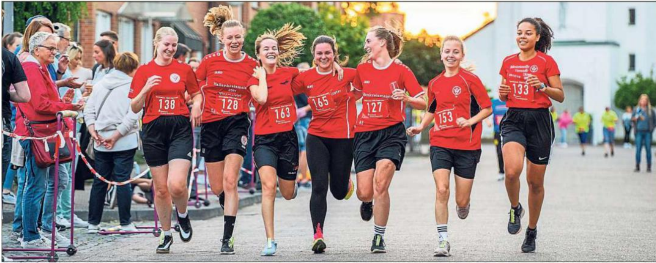
Auf die Plätze, fertig, los! Am Freitag, 1. September, findet der Sparkassen-Pütt-Tage-Lauf statt. Mitmachen kann jeder. Unter anderem auch Vereine, wie die Damenmannschaft von Rot-Weiß Vellern im vergangenen Jahr bewies.